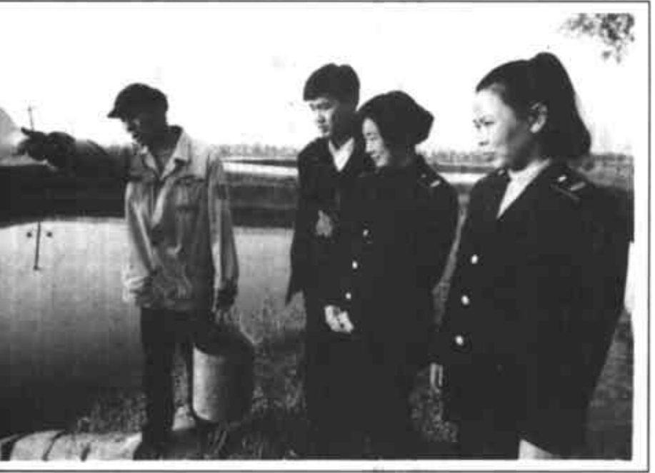
史口镇财政所近两年累计投入40余万元支持镇渔场开发建设。目前,渔场水面已达120余亩,年渔业收入50余万元。图为渔场一角。

本报讯 东营区史口镇财政所充分发挥财政职能作用,大力扶持全镇畜牧业发展。 前王村草场资源多,发展畜牧业条件优越,而该村又有养牛的历史,但苦于缺资金,财政所先后申请贷款5万余元,争取上级支农周转金3万余元,用于扶持该村。现在,该村养牛业已形成规模,达到人均一头牛,养牛数达200头。在前王村带动下,全镇畜牧业蓬勃发展,牲畜头数达16000头。