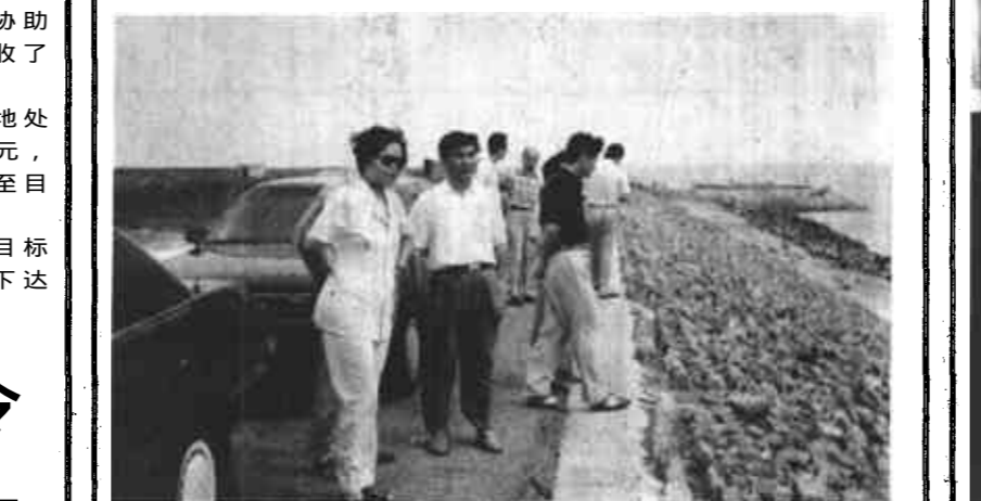
省地矿厅厅长徐日鹏带领省矿业秩序检查组来我市指导工作。